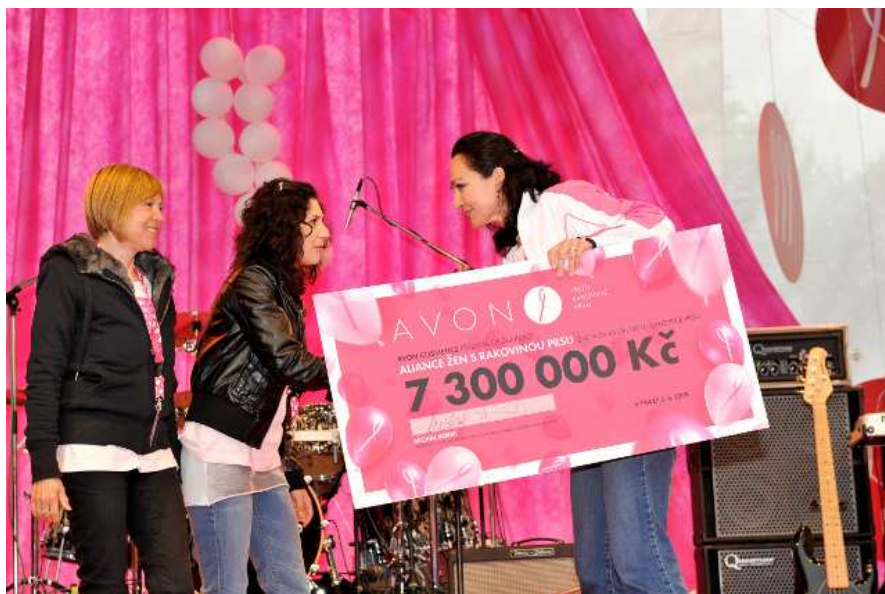
ilustrační foto z Avon pochodu 2009

Start Pochodu je ve 14 hodin z prostor Pražského hradu a návštěvníci budou mít možnost shlédnout výstavu Ondřeje Kavana, jehož fotografie se stala pozvánkou na Avon Pochod.